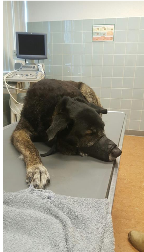
Negen dagen daarna bij de dierenarts.....